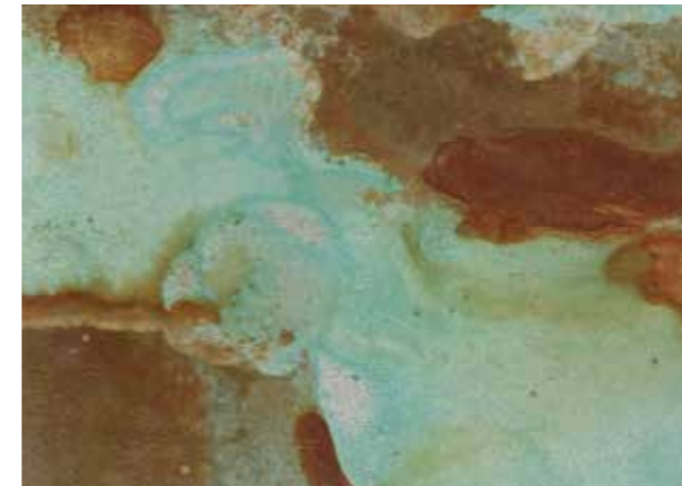
▶ 쿠퍼 그린 (엔틱 브라운 : 쿠퍼 그린 = 1:1)