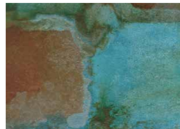
▶ 브론즈 오션 (엔틱 브라운 : 브론즈 오션 = 1:1)