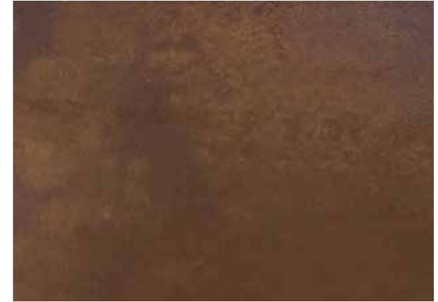
▶ 엔틱 브라운

컬러데코 시리즈는 삼화페인트의 고급 인테리어용 도료로 어디에나 개성있는 공간을 연출할 수 있으며, 컬러데코 메탈 플로어는 부식 효과를 내어 엔틱하고 빈티지한 느낌을 주는 프리미엄 친환경 바닥재입니다.