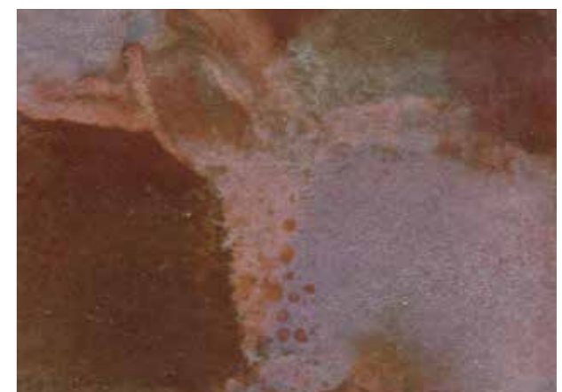
▶ 아이언 핑크 (엔틱 브라운 : 아이언 핑크 = 1:1)

*본 컬러차트의 색상은 시공시 기후조건, 소지면 상태, 시공방법, 도장비율, 건조조건 및 부식액 도포량 등에 따라 실제 색상과 다소 차이가 있을 수 있습니다.