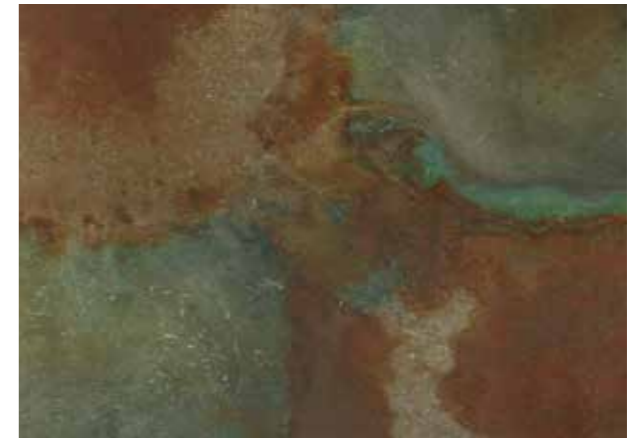
▶ 아이언 갤럭시 (엔틱 브라운 : 아이언 갤럭시 = 1:1)